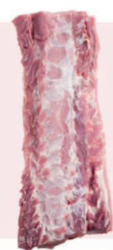
• BACK BACON DE CERDO • PORK BACK LOIN • 猪里脊肉