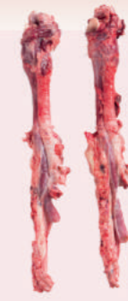
• TRAQUEA CON AORTA, LARINGE Y ESOFAGO DE CERDO • FROZEN PORK TRACHEA, WITH AORTA, LARYNX AND OESOPHAGUS • 冷冻猪气管, 带心管, 喉头和食管