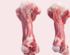
• HUESO DE FEMUR CARNOSO DE CERDO • PORK MEATY FEMUR BONE • 猪带盖多肉后筒骨