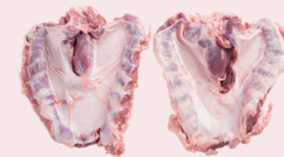
• DIAFRAGMA CON MEMBRANA DE CERDO • PORK DIAPHRAGM MEMBRANE ON • 猪横膈膜