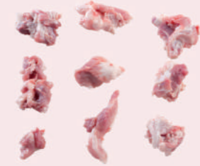
• MAGRO RECORTE PALETA 80/20 DE CERDO • PORK SHOULDER TRIM 80/20 • 猪肩部碎肉80/20