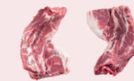
• HUESOS DE CUELLO CARNOSO DE CERDO • PORK MEATY NECKBONES • 猪多肉颈骨