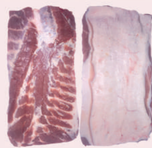
• PANCETA CUADRO SIN PIEL DE CERDO • PORK SHEET RIBBED RINDLESS BELLY • 猪去皮去骨五花肉