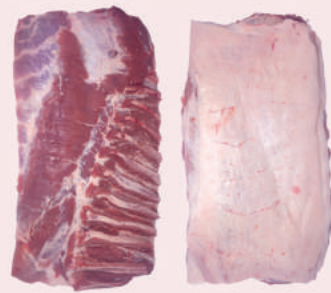
• PANCETA BACON S/PIEL DE CERDO • PORK RINDLESS SINGLE - RIBBED BELLY • 猪挑骨中方