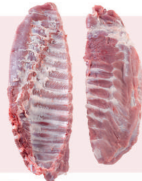
• COSTILLA ESPECIAL DE CERDO • PORK MEATY SPARE RIBS • 猪多肉肋排