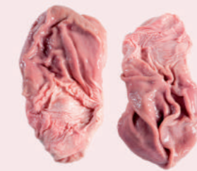
• ESTOMAGOS DE CERDO • PORK STOMACH • 猪肚