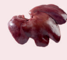
• HIGADO DE CERDO • PORK LIVER • 猪肝