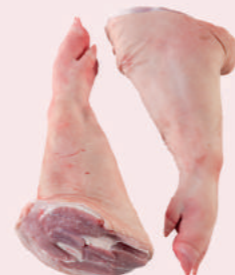
• MANO C/CODILLO DE CERDO • PORK FRONT FEET WITH HOCK • 猪手连肘