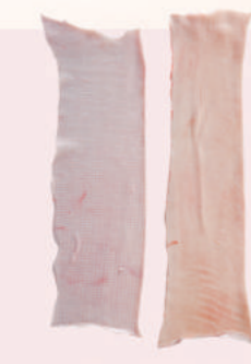
• CORTEZAS LOMO DE CERDO • PORK BACK RIND • 猪背皮