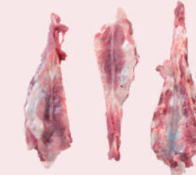
• ESTERNON DE CERDO • PORK STERNUM BONES • 猪胸骨