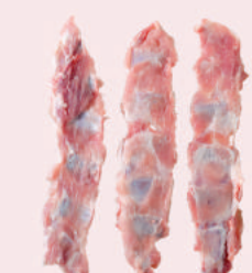
• HUESOS ROSARIO DE CERDO • PORK ROSARY BONES • 猪龙骨边