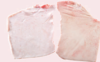
• CORTEZA INDUSTRIAL DE CERDO • PORK MIXED RIND • 猪杂皮