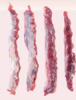
• DIAFRAGMA DE CERDO • PORK DIAPHRAGM • 猪横膈膜