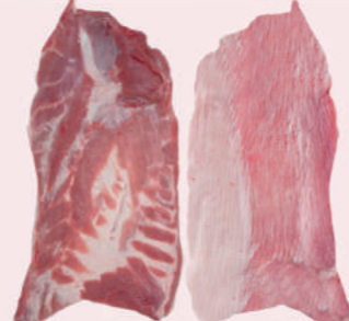
• PANCETA S/PIEL 75/25 DE CERDO • RINDLESS CUTTER BELLY 75/25 • 猪去皮去骨中方