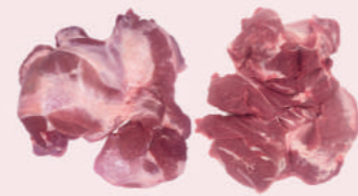
• PALETA 4D PLUS DE CERDO • PORK 4D PLUS SHOULDER • 4D猪前腿肉