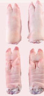
• MANOS DE CERDO • PORK FRONT FEET • 猪手