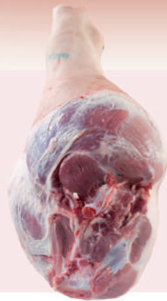
• JAMON C/PIEL S/PATA CARNICERIA • PORK LEG ROUND CUT FOOT OFF • 猪后腿肉圆切