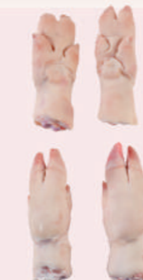
• PATAS DE CERDO • PORK HIND FEET • 猪脚