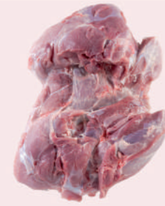
• JAMON 4D PLUS DE CERDO • PORK 4D PLUS LEG • 4D去骨猪后腿肉