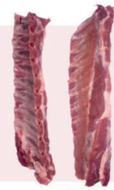
• TIRAS CHULETERO C/CORDON DE CERDO • PORK MEATY LOIN RIBS • 多肉猪脊排