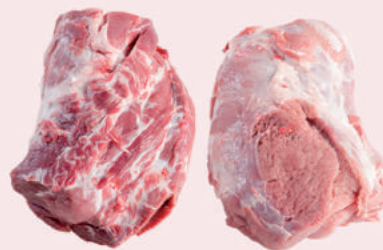
• CABEZA LOMO DE CERDO • BONELESS PORK COLLAR • 去骨猪颈肉