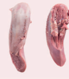
• LENGUAS DE CERDO • PORK TONGUES • 猪舌