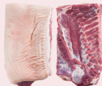
• PANCETA CON PIEL MAGROSA DE CERDO • PORK SHEET RIBBED RIND ON BELLY • 猪带皮五花肉