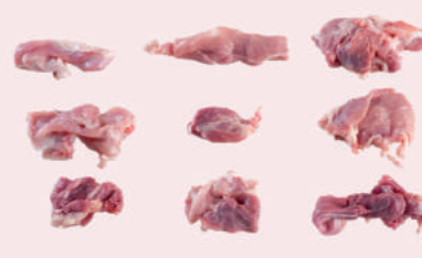
• MAGRO RECORTE JAMON 85/15 DE CERDO • PORK LEG TRIM 85/15 • 猪腿碎肉85/15