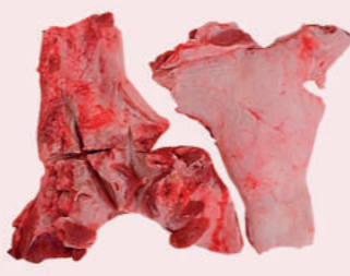
• PAPADA S/PIEL DE CERDO • RINDLESS PORK JOWL • 去皮猪面颊肉