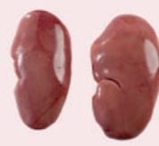
• RIÑONES DE CERDO S/CORTE • PORK KIDNEYS NOT SLASHED • 猪肾