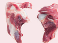
• HUESO DE MEDIO HUMERO CARNOSO DE CERDO • PORK MEATY HALF HUMERUS BONE • 猪多肉半截前筒骨