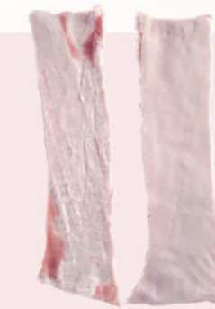
• TOCINO LOMO S/PIEL 20/80 DE CERDO • PORK RINDLESS BACKFAT 20/80 • 猪去皮背膘