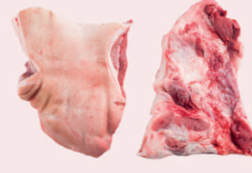
• PAPADA CON PIEL DE CERDO • RIND ON PORK JOWL • 猪带皮下颚肉