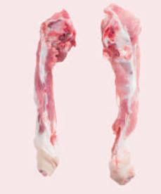
• HUESO DE RABO DE CERDO • PORK TAIL BONE • 猪尾骨