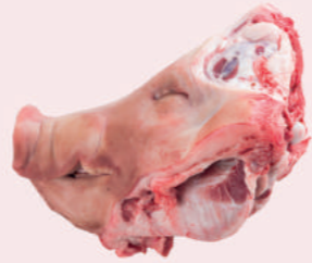
• CABEZA S/OREJA S/CARRILLADA • PORK HEAD EAR OFF CHEEK OFF • 冷冻猪头去耳去口脷去脸颊肉