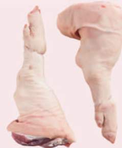
• PATA CON CODILLO DE CERDO • PORK HIND FEET WITH HOCK • 冷冻猪脚连蹄