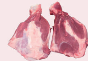
• HUESO RAQUETA CARNOSO DE CERDO • PORK MEATY BLADE BONE • 冷冻多肉猪扇骨