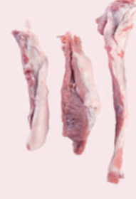
• MAGRO L.CHULETERO 75/25 DE CERDO • PORK LOIN TRIM 75/25 • 猪里脊碎肉75/25