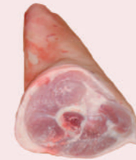
• CODILLO PALETA C/PIEL • PORK FRONT HOCK RIND ON • 冷冻猪蹄膀