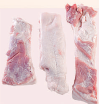
• PANC INDUSTRIAL S/PIEL 60/40 DE CERDO • RINDLESS PORK BELLY TRIM 60/40 • 去皮猪腹部碎肉