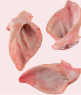
• OREJAS DE CERDO • PORK EARS • 猪耳