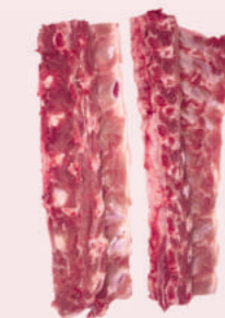
• HUESO ESPINAZO • PORK BACKBONE • 猪背骨